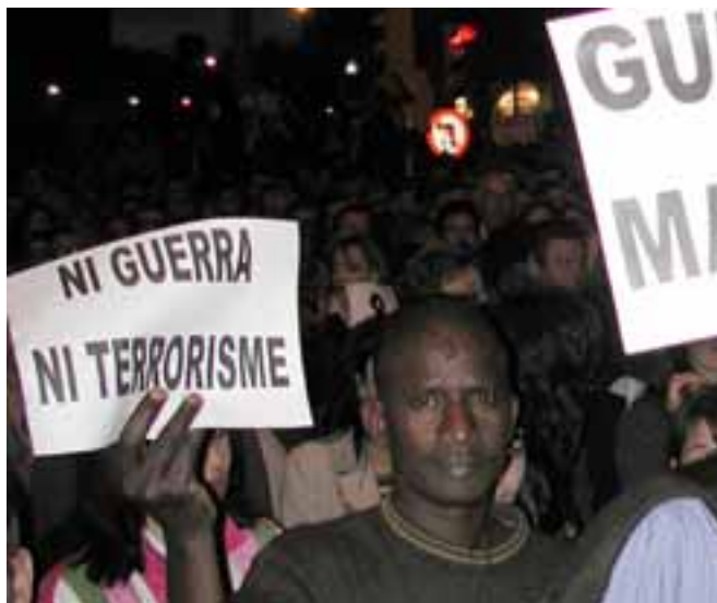
A la concentració de Ciutat de Mallorca.