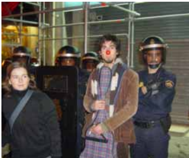
La seu del PP de Barcelona, dissabte a la nit.