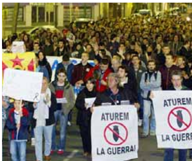
A la Rambla de Tarragona.