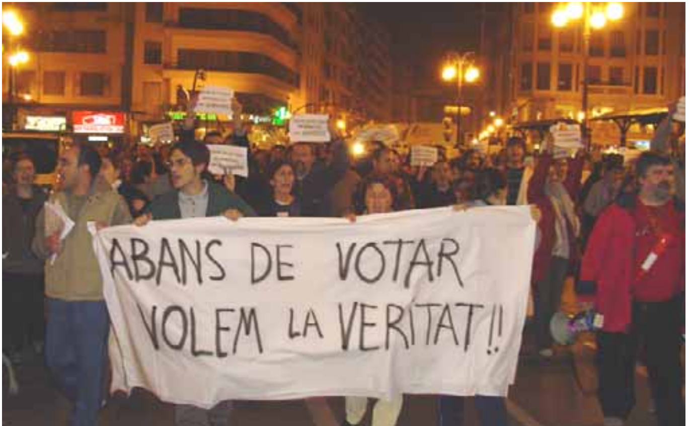
Manifestació a València de dissabte a la nit.

“Revolta democràtica”. Així titulàvem dissabte a la tarda des de la portada de VilaWeb. Van ser unes hores frenètiques. Els mòbils, cap a migdia, alertaven de mobilitzacions imminents. Per telèfon alguns dirigents polítics expressaven l'horror i la incredulitat davant el que passava. La policia i els ser-