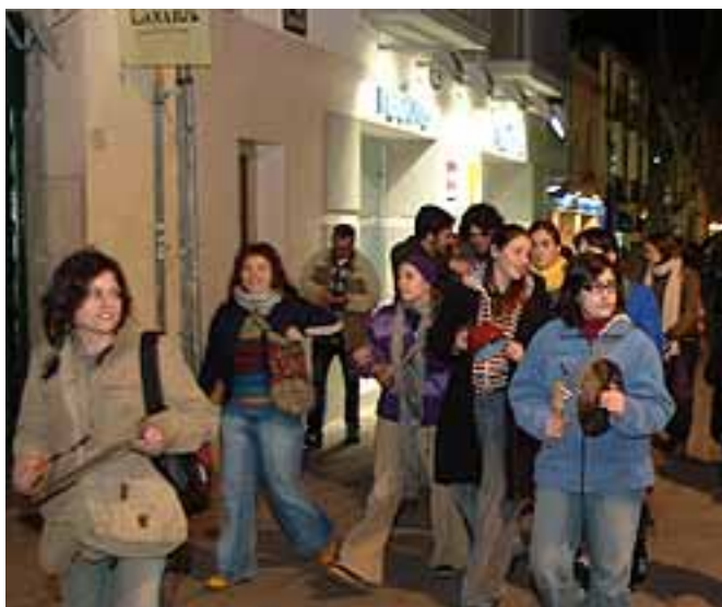
Perolada espontània a Girona.