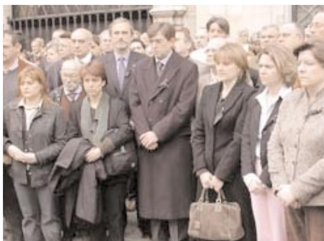
Concentració al parlament de les Illes aquest matí

El president del govern espanyol, José María Aznar, ha hagut de compareixer en una nova roda de premsa aquest matí per parlar dels atemptats a Madrid. Aznar, visiblement irritat, ha defensat l'actuació del seu govern i especialment del ministre de l'interior però no s'ha atrevit a afirmar que al Qaeda no té res a veure amb els atemptats. A preguntes dels periodistes, amb els quals ha arribat a estar fins i