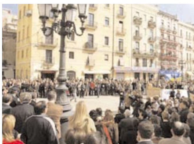
Concentració a la Rambla de Tarragona aquest matí

tot impertinent, Aznar ha dit que la hipòtesi d'ETA "era i és" la més lògica però que no pot descartar ara una altra hipòtesi. El president del govern espanyol s'ha mostrat especialment crispat quan se li ha demanat si es ratifica en la seva política exterior. Mentrestant creixen les veus que reclamen explicacions clares al govern espanyol. El lehendakari Ibarretxe ho ha exigit després de justificar